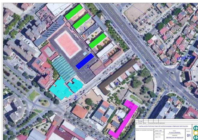
Ilustración 1: Edificios con autoconsumo compartido

La licitación contempla además la tramitación de estas instalaciones junto con otras existentes en la manzana, para su legalización en modalidad de “Autoconsumo compartido” según se establece en el RD 244/2019 de 5 de abril.