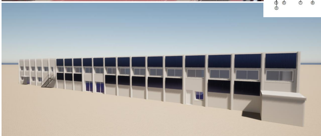
Imagen-2: Detalle de SATE + Cámara de aire + Instalación Fotovoltaica vertical

Los principales datos de la licitación son: